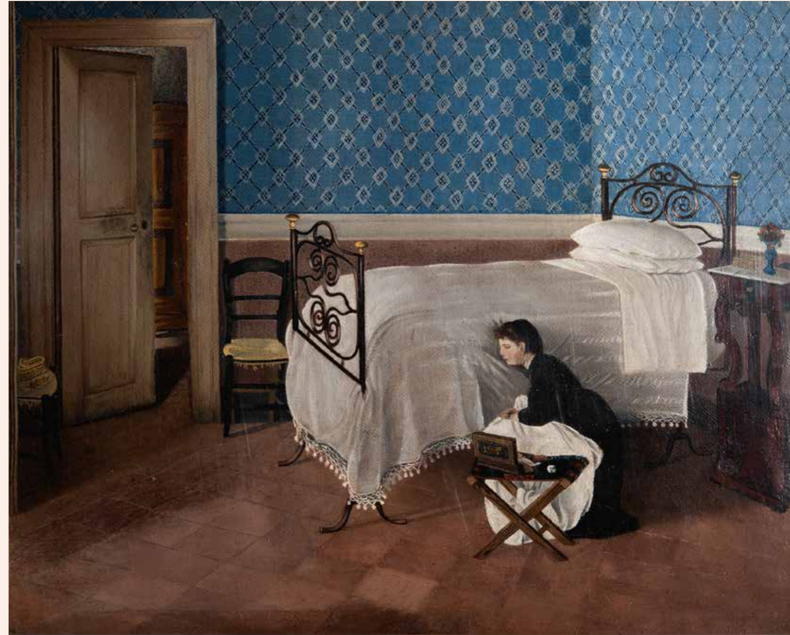
Adriano Cecioni, Interno con figura , ca. 1868, olieverf op doek, 54 x 61.5 cm, Galleria Nazionale d'Arte Moderna e Contemporanea, Rome