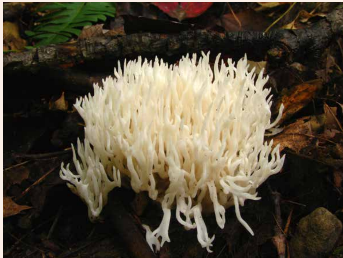
Koraalpaddestoel (Ramariopsis kunzei) , privéverzameling