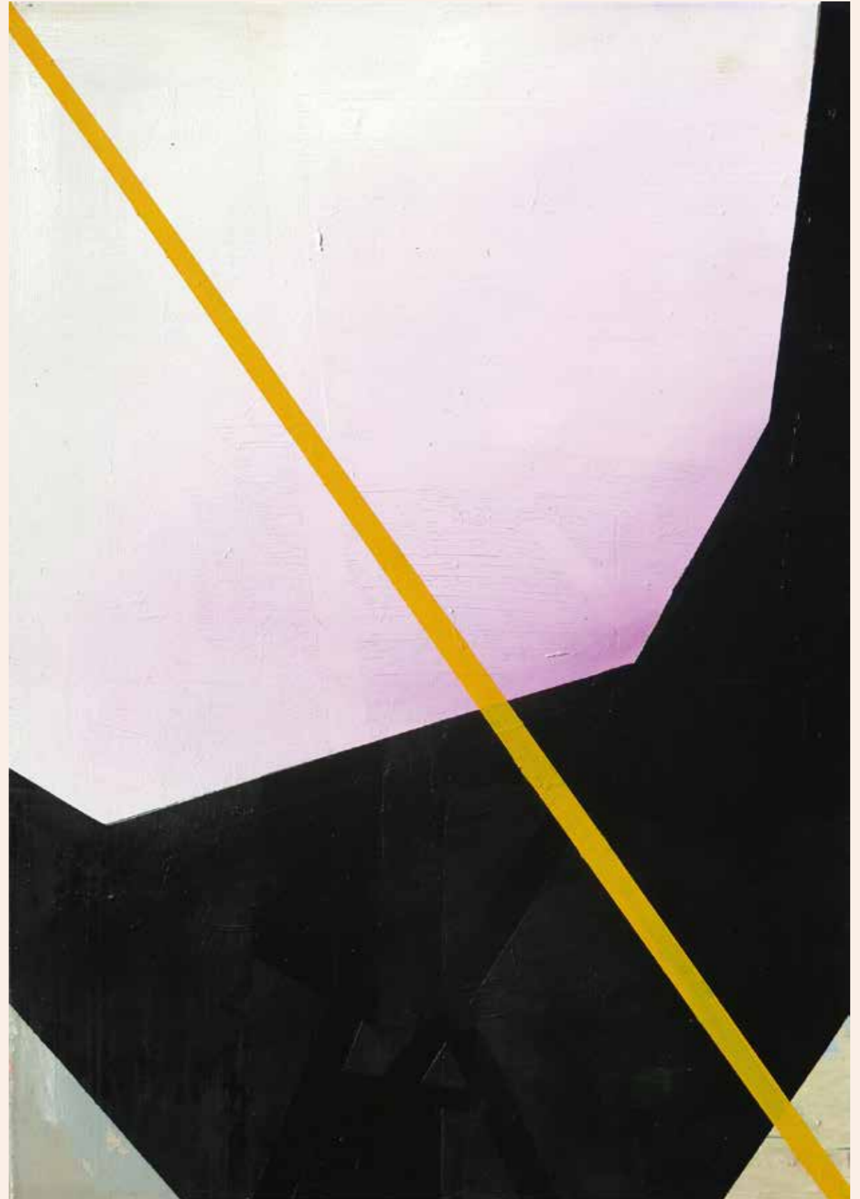
rechts: Christophe Denys, zonder titel , 2013, olieverf op doek, 100 x 70 cm, privéverzameling