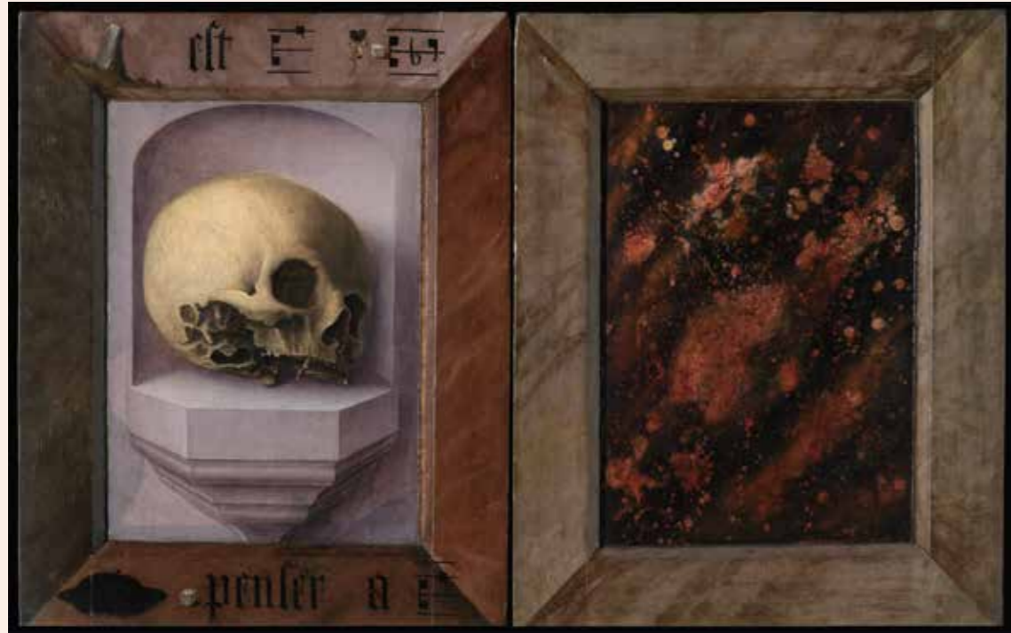
Jan Provoost, Keerzijde van een diptiek met memento mori en steenimitatie , 1522, olieverf op paneel, 50 x 40 cm, Sint-Janshospitaal, Brugge